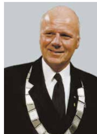
Ehrenpräsident des HESSISCHEN SCHÜTZENVERBANDES E.V. Klaus Seeger

2013 wurde er zum DSB-Vizepräsidenten für „Schützentradition und Brauchtum“ gewählt und zwei Jahre später hatte er großen Anteil daran, dass das „Schützenwesens in Deutschland“ in das Bundesweite Verzeichnis des immateriellen Kulturerbes durch die deutsche UNESCO-Kommission aufgenommen wurde. Beim Deutschen Schützentag in Frankfurt wurde er im Alter von 57 Jahren am 29. April 2017 zum Präsidenten des Deutschen Schützenbundes gewählt. Im Hessischen Schützenverband wurde er daraufhin zum Ehrenpräsidenten ernannt.