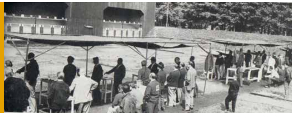
Deutsche Meisterschaft 1963 in Wiesbaden – Pistole

den der Wiesbadener SG ausgetragen wurden. In der hessischen Schützenhochburg dominierten erwartungsgemäß die gastgebenden WSG-Schützen mit 16 gewonnenen Meistertiteln.