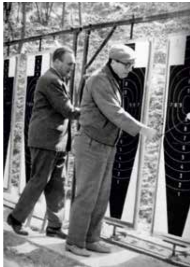
Deutsche Meisterschaft 1962 – Luftpistolestand in Wiesbaden