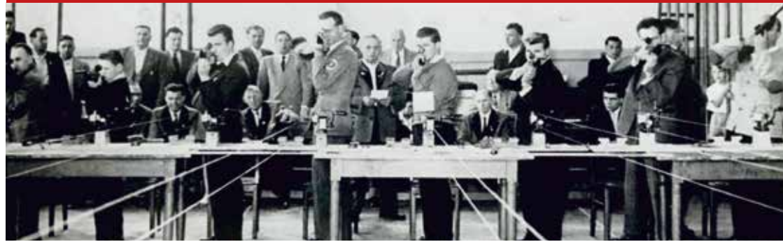
Vereins-Fernwettbewerb in Wiesbaden